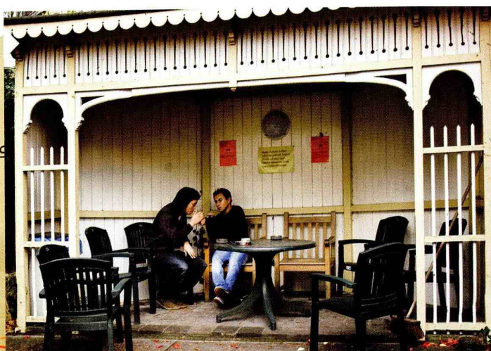
In de pauze een sigaret op de binnenplaats

vertellen hoe het moet, je moet het ze laten ervaren”, aldus Figlarz. Met verschillende oefeningen uit het werkboek gaan de patiënten aan de