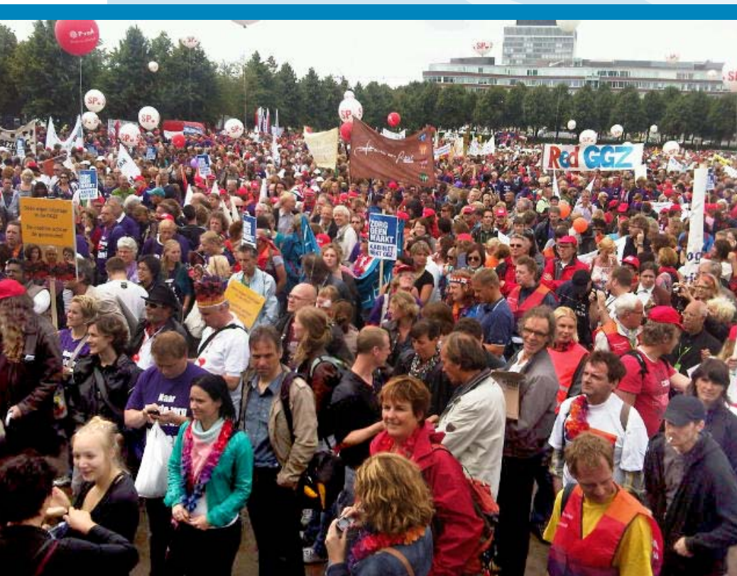
CLIËNTEN, OUDERS EN COLLEGA'S VOEREN ACTIE OP DE NEUDE

Ongetwijfeld heeft u als betrokkene van ABC ook gehoord van de bezuinigingen die zijn voorgesteld door Minister Schippers. Naast een grote algemene bezuiniging op psychiatrische ziekenhuizen is ook een extra eigen bijdrage voorgesteld voor mensen die zorg ontvangen uit de zogenaamde tweedelijns GGZ, zoals ABC.