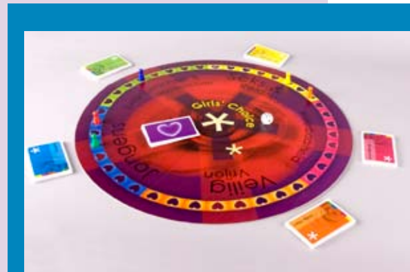
SPEL 'GIRLS CHOICE'