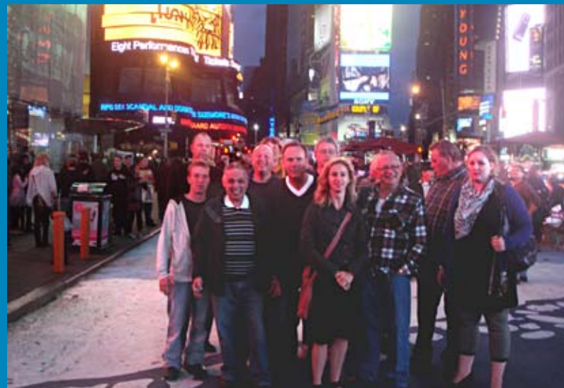
DE GROEP ERVARINGSDESKUNDIGEN IN NEW YORK

Hij vertelde hoe het is om psychotisch te zijn, waar je doorheen moet, wat het met je leven, je ambities, je zelfbeeld doet, wat het voor anderen betekent. Het WRAP heeft hem geholpen bij zijn herstel. Hij heeft zich los kunnen maken van het zelfstigma en daarmee een enorme stap gezet richting herstel. Hij schrijft artikelen voor een medisch vakblad, heeft Portugees onderwezen, is wetenschappelijk medewerker bij een universiteit en hij runt een consultatiebureau voor herstel. Hij heeft zijn capaciteiten en ervaringen ten volle benut. De belangrijkste les die we van hem kunnen leren is dat herstel bestaat! Dat wil ik overbrengen